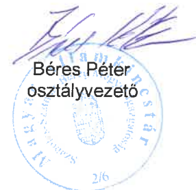
Béres Péter osztályvezető

Melléklet: 1 példány Készült: 2 példányban Kapják: 1. sz. pld.: Címzett 2. sz. pld.: Irattár