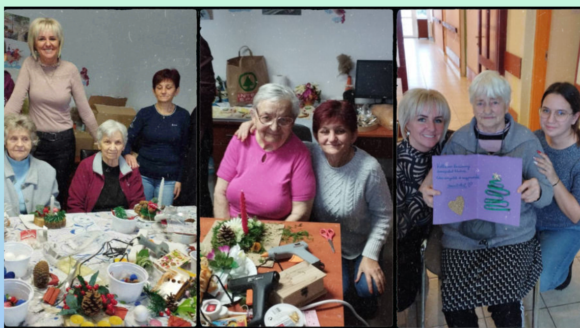
(Újra) tervezés - Életvidám Időskor című pályázat

Május hónapban már a helyi Dankó Néptáncsoportunk is itt folytatta próbáit és lelkesen készültek a helyi Általános Iskola Színtársulókörös tagjai is a szintén pályázat forrásból megvalósuló közös rendezvényünkhöz, színházi előadásunkhoz. Így került megrendezésre 2023. június 02-án, pénteken a Nemzeti Kulturális Alap támogatásával a Petőfi 200 emlékéhez kapcsolódóan a János Vitéz színpadi változatának bemutatására a helyi általános iskola színtársulókörének diákjaival és Dankó Néptáncsoport közreműködésével.